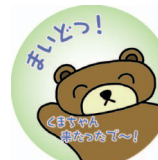
くまちゃん来たったで〜