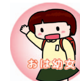
おは幼女(お姉ちゃん)