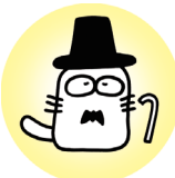
にやもちくん (紳士Ver.)